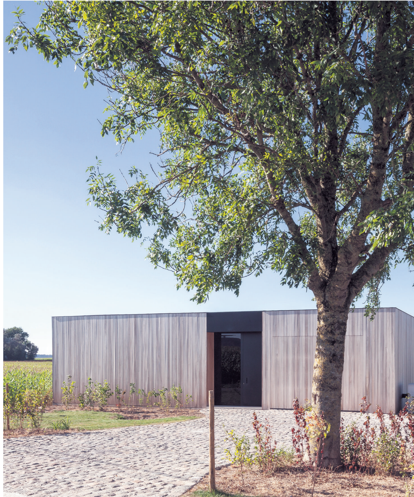
De gevel van de woning is bekleed met het duurzame Ayous thermowood, een tropische zachthoutsoort die onder natuurlijke verwerking grijs wordt. De voordeur in getint glas omhelst de strakke vormgeving en geeft de bewoners - zonder inblik van buitenaf - de nodige privacy.

BINNENKIJKEN IN EEN MINIMALISTISCHE BUNGALOW IN WESTOUTER